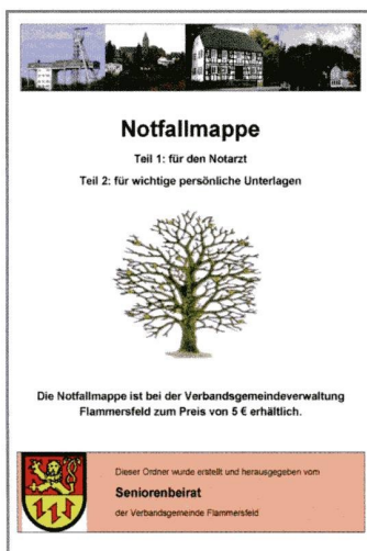
Ottmar Fuchs Bürgermeister